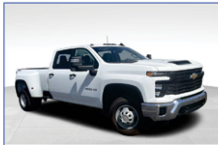
2024 CHEVROLET SILVERADO

CELEBRAMOS QUE TENEMOS 11 AÑOS TRABAJANDO CON EL PROGRAMA W7