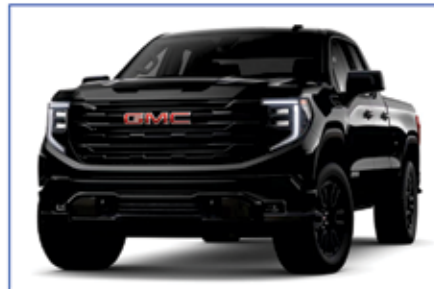
2023 GMC SIERRA 1500