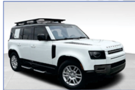
2022 LAND ROVER DEFENDER X-DYNAMIC SE