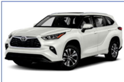
2021 TOYOTA HIGHLANDER