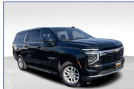
2025 CHEVROLET SUBURBAN LS

LOS MEJORES PRECIOS DE NASHVILLE Lowest Prices in Tennessee