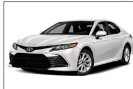
2022 TOYOTA CAMRY LE

CELEBRAMOS QUE TENEMOS 11 AÑOS TRABAJANDO CON EL PROGRAMA W7