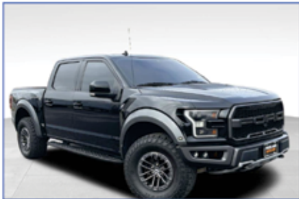
2019 FORD F-150 RAPTOR

OVER 1,000 VEHICLES IN INVENTORY TO CHOOSE FROM