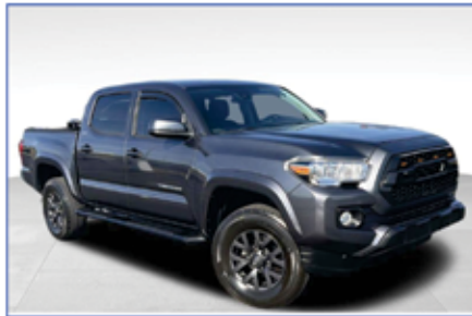
2020 TOYOTA TACOMA SR5